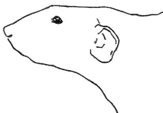
Uložení ucha - varieta dumbo